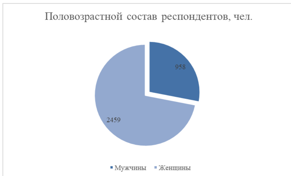
Диаграмма № 1

Очное интервьюирование респондентов осуществлено непосредственно на территории образовательных организаций. Охват численности респондентов соответствует требованиям, предъявляемым к численности и структуре выборочной совокупности респондентов (Диаграмма № 1).